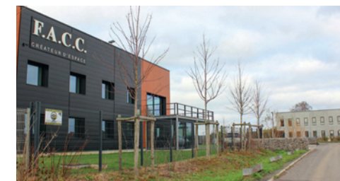
F.A.C.C. et GTF Marquion à droite

professionnel, elle s'est diversifiée avec la création de PGE, société de chauffage, climatisation, électricité et plomberie et de DG.Concept62, créateur de chalets et studios de jardin. Sa croissance remarquable justifie l'extension de ses locaux. Il en va de même pour Alurol qui s'affirme dans la fabrication de menuiseries aluminium et dont le développement rapide mène à une extension de son bâtiment. Enfin, GTF Marquion construit un bâtiment locatif de 600 m 2 qui sera bientôt investi par une agence GSF Stella, entreprise de nettoyage d'ACC. Ces cinq entreprises illustrent la dynamique économique positive du Parc avec à la clé de nombreuses créations d'emplois à venir. ■